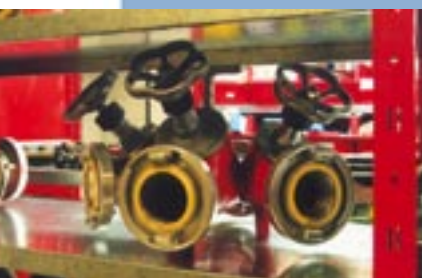
Magazijn Brandweer Alkmaar, veelzijdig!

Magazijnruimte is kostbaar. Efficiëntie per meter 3 is het credo. Belangrijk is dan een functionele opslag waar ook nog eens economisch gewerkt kan worden. Voor deze eisen is het GS-3-legbordsysteem uw juiste keus. Een volledig Nederlands kwaliteitsproduct dat wordt gefabriceerd volgens de strenge ISO-9002:2000 norm. De stijlen,