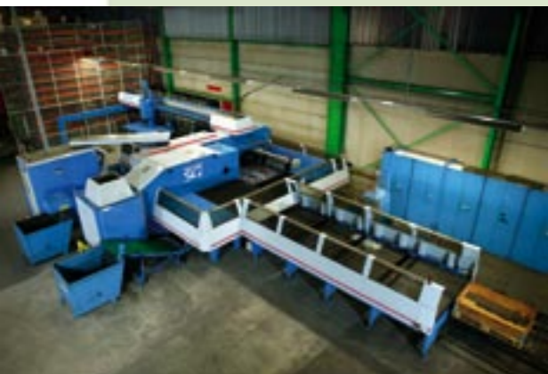
Ponsnibbelmachine met geïntegreerde hoekschaar

Het kloppend hart van de plaatbewerking wordt gevormd door de ponsnibbelmachine met geïntegreerde hoekschaar. Deze Finnpower SG-6 is voorzien van automatische aanvoer van materialen en afvoer van producten. Een reus die in staat is grote hoevee-