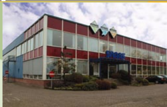
Modern geoutilleerde pand Snaas

Binnen de industrie neemt metaal een allesoverheersende plaats in. Kwaliteit is hierbij van doorslaggevende betekenis. Daarom stelt u hoge eisen aan de functionaliteit en duurzaamheid van de metalen onderdelen.